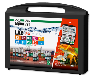
JBL PROAQUATEST LAB Koi Professioneller Testkoffer für Koi- und Gartenteich