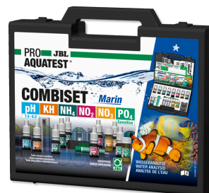
JBL PROAQUATEST COMBISET Marin Testkoffer für Wasseranalysen in Meerwasseraquarien