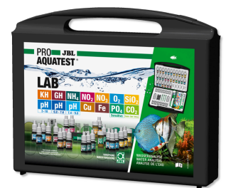
JBL PROAQUATEST LAB Testkoffer mit 13 Wassertests zur Süßwasser-Analyse