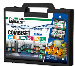
JBL PROAQUATEST COMBISET Marin Testkoffer für Wasseranalysen in Meerwasseraquarien