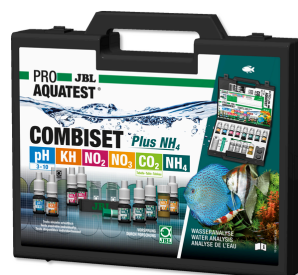
JBL PROAQUATEST COMBISET Plus NH 4 Testkoffer mit den wichtigsten Wassertests + NH 4 -Test