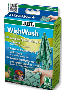
JBL WishWash Reinigungstuch und Schwamm