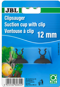
JBL Clipsauger 12 mm Gummsauger mit Clips für Objekte mit 12 mm