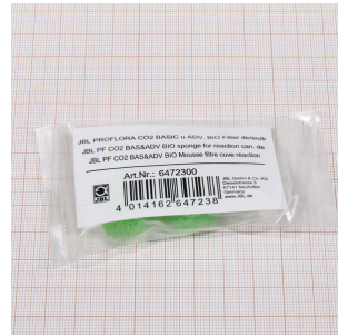
JBL PF CO2 BIO REAKTOR Filter