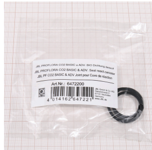
JBL PF CO2 BIO REAKTOR Dichtung