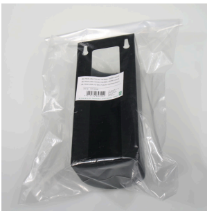
JBL PF CO2 BIO THERMAL CASING